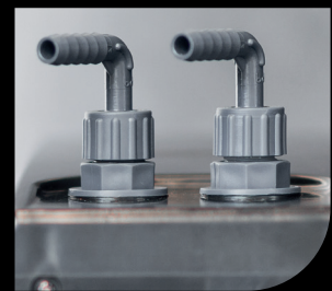
Giunti acqua / Water Joints