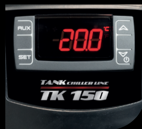
Termostato / Thermostat